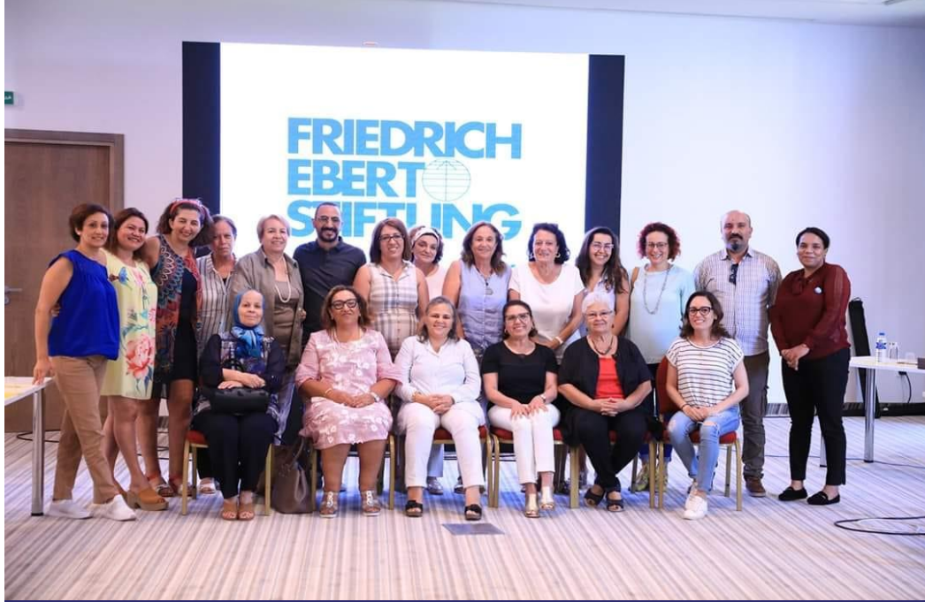
Participation de la LET à un atelier de plaidoyer pour l'égalité dans l'héritage entre les hommes et les femmes dans le cadre d'un programme lancé par la fondation Friedrich-Ebert-Stiftung Tunisie le 25 et 26 Juillet 2020